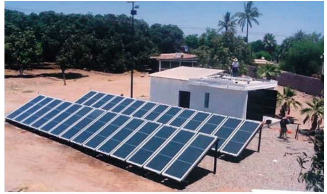
“DESHIDRATADOR INDUSTRIAL PARA CHILE, LOS MOCHIS, SINALOA”