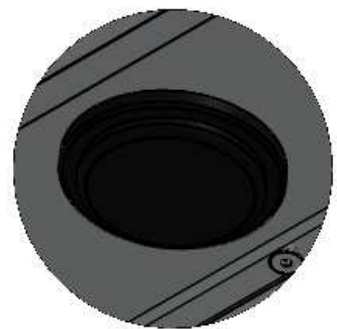
SENSOR DE MOVIMIENTO